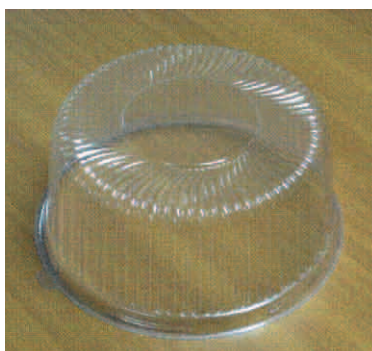
КРЫШКА ДЛЯ УПАКОВКИ ДЛЯ ТОРТА

Кроме того, абсурдность ситуации заключалась и в том, что упаковки для торта со спорным рельефом производились ответчиками намного раньше, чем была подана заявка на регистрацию товарного знака (этот вывод содержался и в решении суда).