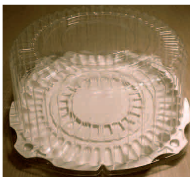
УПАКОВКА ДЛЯ ТОРТА С КРЫШКОЙ

пластиковых упаковок. Указанные товарные знаки были зарегистрированы в отношении товаров 16 и 30 классов МКТУ (пластиковая упаковка и кондитерские изделия).