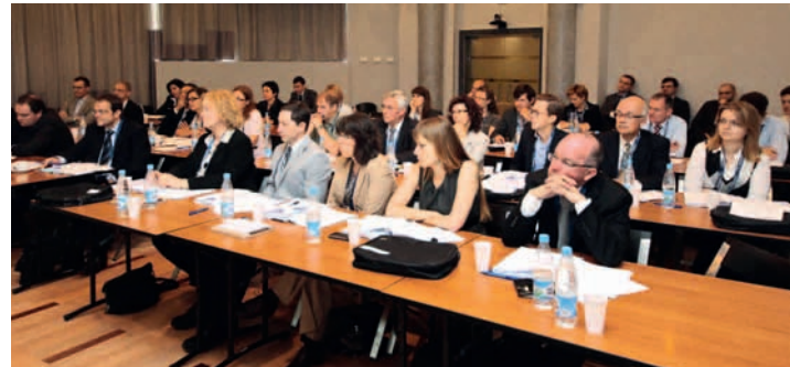
НА ФОТО: УЧАСТНИКИ СЕМИНАРА

В московском офисе фирмы «Городисский и Партнеры» прошел 8-й ежегодный международный семинар «Приобретение и защита прав интеллектуальной собственности в России».